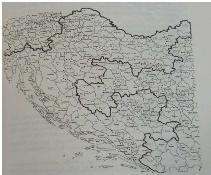
Slika 1. Globusova karta o podjeli Bosne i Hercegovine 1. (Izvor: Anto Valenta. Podjela Bosne i borba za cjelovitost ).